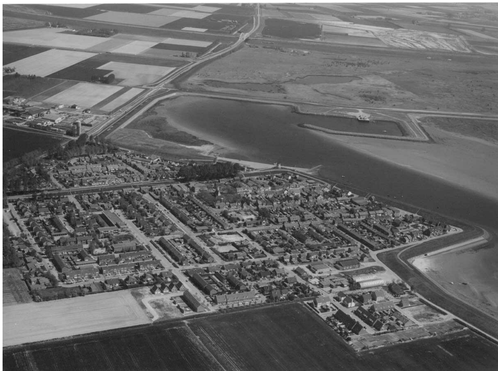
Luchtfoto Sint-Philipsland 1991