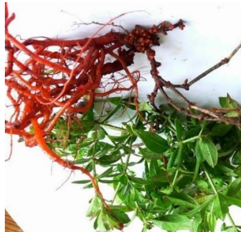
Wortel en plant